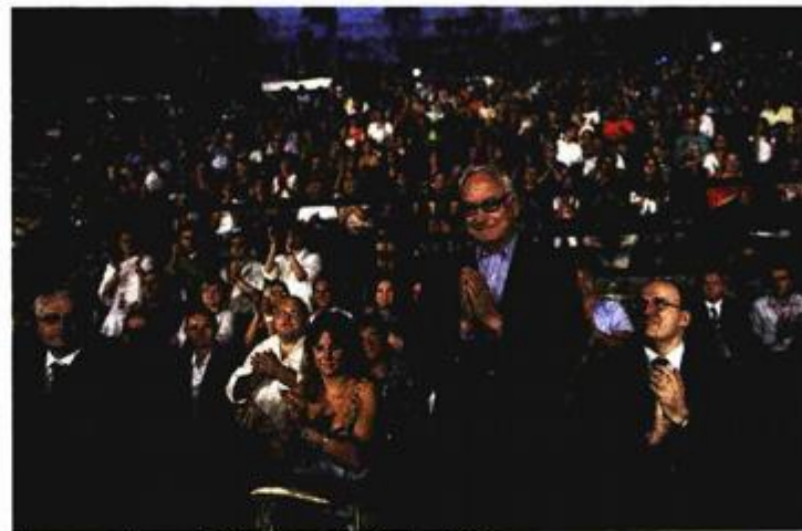
Ivory na otvorenju Filmskoga festivala u Puli

- Mislim da je početak bio najljepši. Ako smo Ismail i ja imali herojski period u našoj karijeri, onda je to bilo kada smo tek počinjali u Indiji. Jer počeli smo od ničega, i okupivši iznimne ljude oko sebe uspjeli smo stvoriti nešto veliko. I to su bili najsajniji trenuci moje karijere, a ne vrijeme kad smo već postali slavni i ostvarili najveće komercijalne uspjehe. Ja ipak radije gledam unatrag, u te prve dane, tada smo bili najjači.