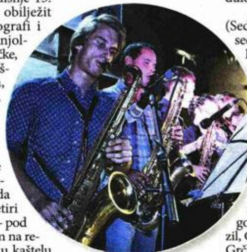
Ljetna Jazz akademija u Grožnjanu

te uživati u Grožnjanu na međunarodnom jazz festivalu Jazz is Back BP. Dobru glazbu upotpunjuju i obogaćuju raznolikost i spontani duh, a u tom će duhu ovog ljeta jedinstveni istarski grad umjetnika, posjetiti brojni