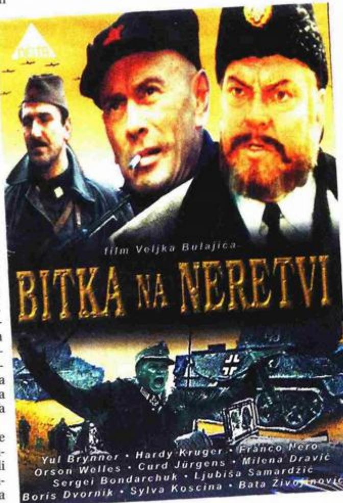
“Bitka na Neretvi” - milijunska gledanost kod kuće i u svijetu

Plakat za “Bitku na Neretvi” izradio je veliki Picasso, godine 1970. film je bio nominiran za Oscara u kategoriji stranog filma, a prije tri godine na festivalu u Moskvi uvršten je među deset najznačajnijih filmova o Drugom svjetskom ratu