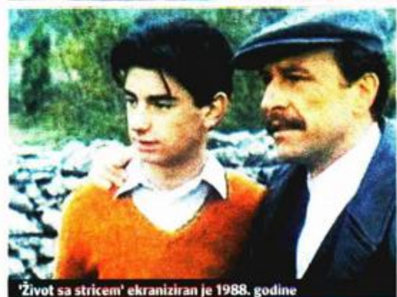
'Život sa stricem' ekraniziran je 1988. godine