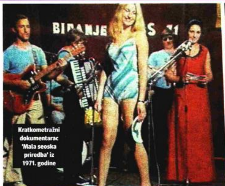
Kratkometražni dokumentarac 'Mala seoska priredba' iz 1971. godine