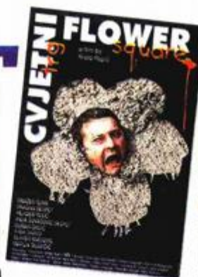
'Izbavitelja' je snimio 1976., a 'Cvjetni trg' još uvijek čeka premijeru