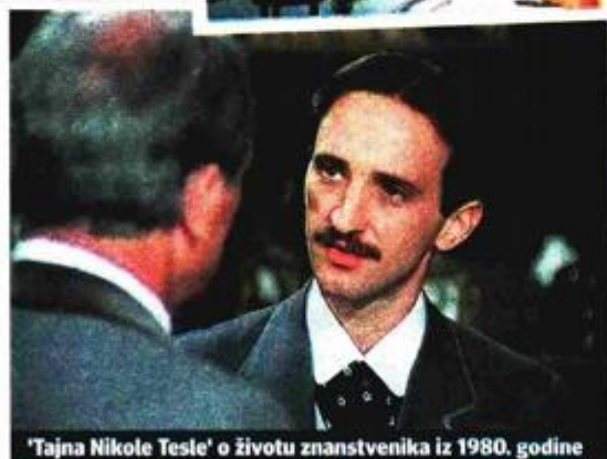
'Tajna Nikole Tesle' o životu znanstvenika iz 1980. godine