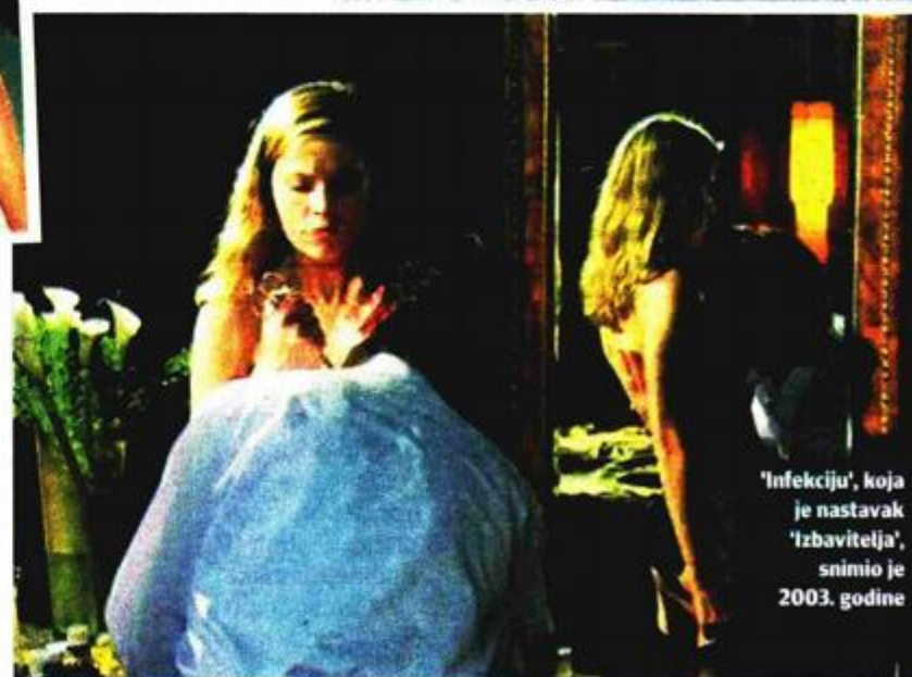
'Infekciju', koja je nastavak 'Izbavitelja', snimio je 2003. godine