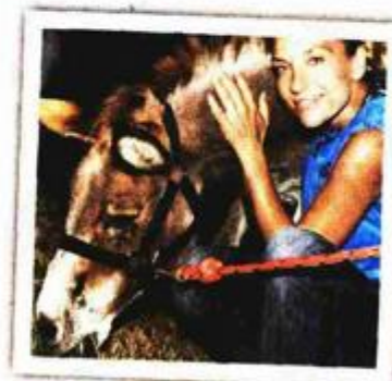
SIMPA SU, ALI NE ZA JAHANJE Na akciji za skupljanje sredstava za farmu magaraca na Murteru jednog je zajahala bez sedla i nije joj se svidjelo

- Ali jednog dana, bila sam tek treći razred gimnazije, profesorica hrvatskog jezika rekla nam je tko želi na glumačku audiciju u Osijek, dobit će opravdane izostanke u školi. Oduševila me ideja da jedan dan ne idem u školu, na brzinu sam naučila monolog barunice Castelli iz "Gospode Glembajevih" i prošla. Bilo je traumatično reći roditeljima da se u roku od sedam dana moram iz Našica odseliti u Osijek, prekinuti školovanje i početi nešto o čemu nikada nisam ni pričala. Bila je