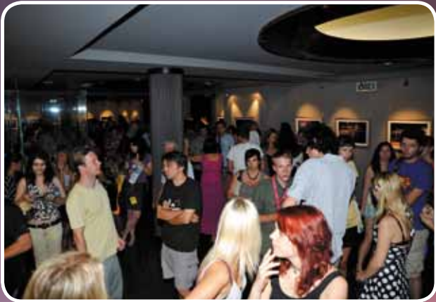
Predstava u Kinu Valli