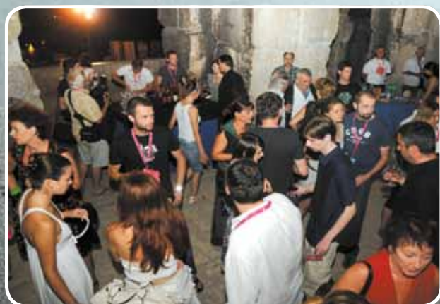
Šuma summarum u Areni