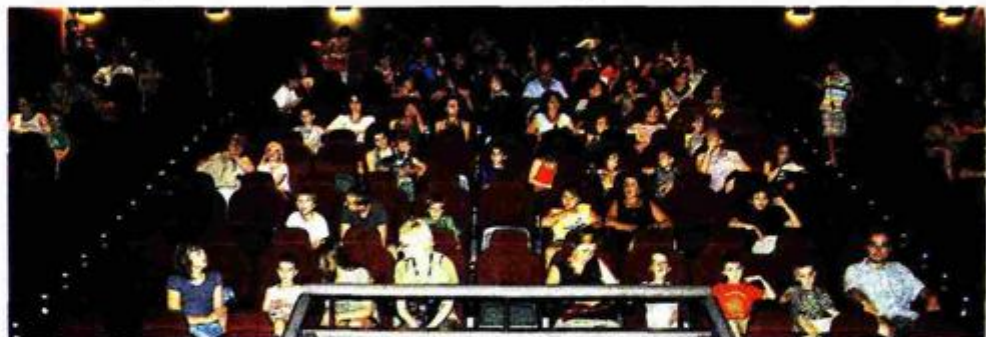
Uoči projekcije u Kinu Valli najviše je bilo najmlađih

Dojam je da je gledanje filma "teže" palo njihovim roditeljima, danas sredovječnim 30, 40 i