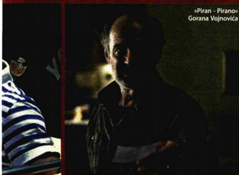
»Piran - Pirano« Gorana Vojnovića