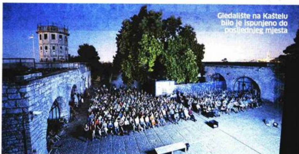
Gledalište na Kaštelu bilo je ispunjeno do posljednjeg mjesta