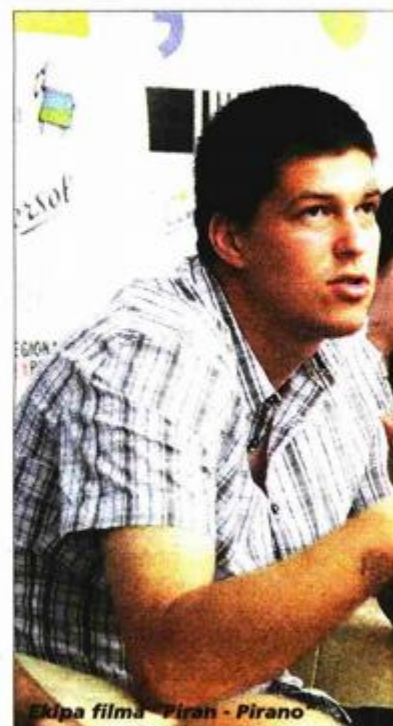
Ekipa filma "Piran - Pirano"

ma "Piran - Pirano", također je debitant, a predstavljajući film kazao je da je ideja stara već šest godina.