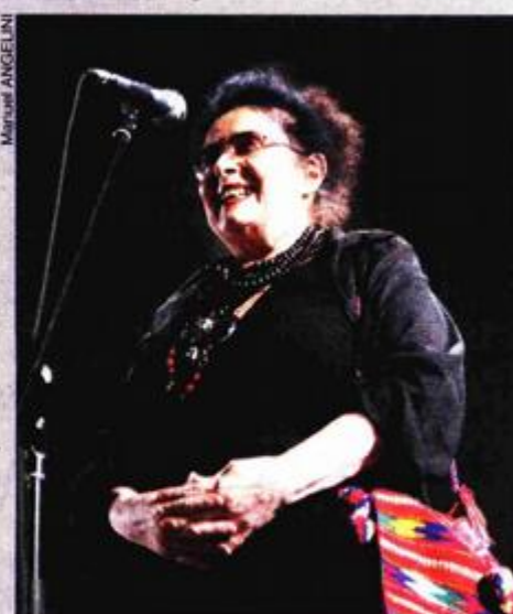
Božidarka Frait u Areni

Glumica Božidarka Frait, koja ove godine glumi u filmu "Korak po korak", ovogodišnji je laureat nagrade Vladimir Nazor za životni doprinos filmskoj umjetnosti. - Kada sam jučer došla nagradu u Areni, bio je to fantastičan osjećaj. To je nepovljivo, a tako odgojenu i ljubaznu publiku nikad nisam vidjela. Kao glumica nisam nikad gledala je li uloga koja mi je ponuđena mala ili velika. U filmu ili jesi ili nisi. Čak i u minijaturi treba dati sve od sebe kao da je uloga velika. Rado prihvaćam uloge u filmovima debitanta i voljela bih da ih je što više. Nadam se da ćemo naći novaca i dati im priliku da se dokažu, kazala je Frait na jučerašnjoj konferenciji za novinare u Circolu.