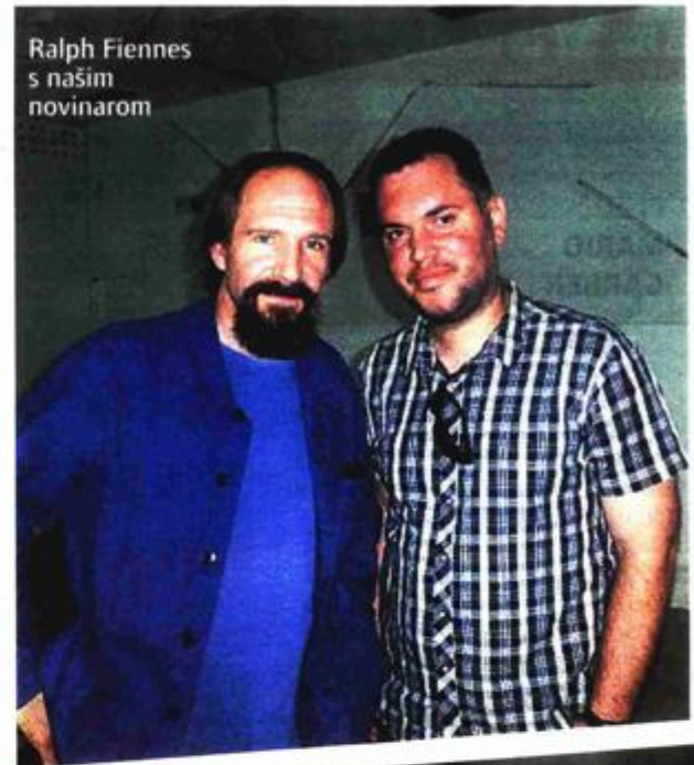
Ralph Fiennes s našim novinarom