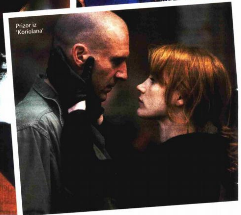
Prizor iz 'Koriolana'

interesiran za ljudsko biće. Koriolan je dječak u tijelu čovjeka, izgubljen. Njegova duša je izgubljena, djetinjstvo mu otrovano. Nema razvijenu empatiju. Priča o izgubljenom dječaku, to je tragedija u ovom filmu.