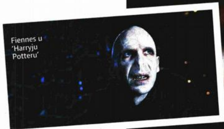
Fiennes u 'Harryju Potteru'

EKSKLUZIVNO Ralph Fiennes, glumački velikan i novopečeni redatelj filma 'Koriolan', premijerno prikazanog na festivalu u Puli