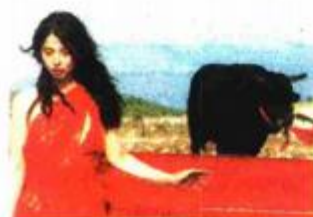
Prizor iz filma 'Sonja i bik'

•• Donedavno je bilo izvjesno da će se na Puli prikazati i drugijenac Filipa Šovagovića "Visoka modna napetost", sa Stjepanom Mesićem u jednoj od uloga, međutim film je na kraju ipak ispao s popisa. Uz malo sreće vidjet ćemo ga na 60. Puli.