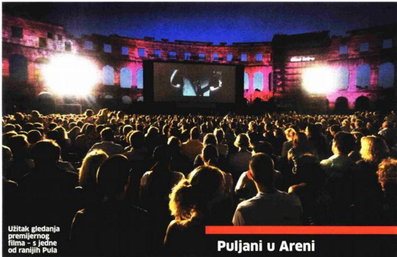
Užitak gledanja premijernog filma – s jedne od ranijih Pula