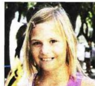
Maristelli su se filmovi dopali