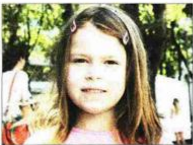
Katarini se svidjela priča o zečevima