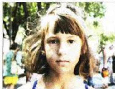
Klara voli filmski ugodaj