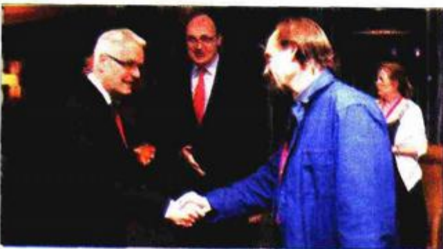
S predsjednikom Josipovićem

- Koriolan je ekstremni lik, čovjek iznimne hrabrosti koji zatambljuje sve emocije koje mu na borilištu nisu korisne. S te strane kao psihopat - odlučan je u tome da bude uvijek on, da ne glumata i ne cjenka se s onim što ne želi. Glumiti tako ekstremno netolerantnog lika je pravi izazov dodamo li tome njegove snažne reakcije i bijes te linije dijaloga koje je Shakespeare njemu namijenio. Koriolanov jezik je dinamičan i provokativan - to je kao da voziš Ferrari. No sada mi je puna kapa ovakvih likova i rekao sam svom agentu da više ne želim glumiti te zlikovce iako volim uloge koje su moralno dvosmislene, kazao je Fiennes.