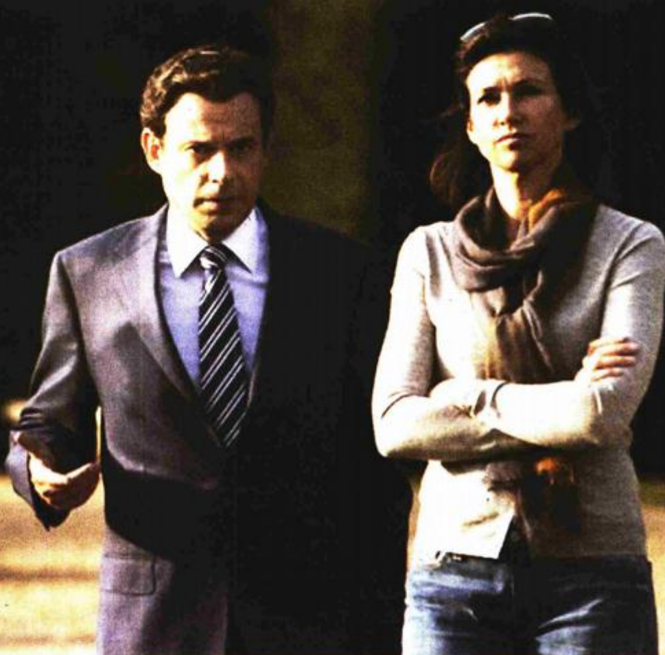
Iz filma "Sarkozy"

U Francuskoj je važno biti socijalist i glasati za desnicu, a opravdavati se da sve činite kako na vlast ne bi došla radikalna nacionalistička obitelj Le Pen, i obavezno imati ljubavnicu ako želite nešto značiti u politici