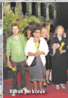
Korak po korak