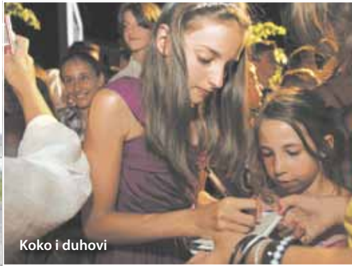
Koko i duhovi