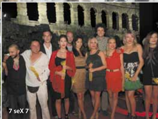
7 seX 7