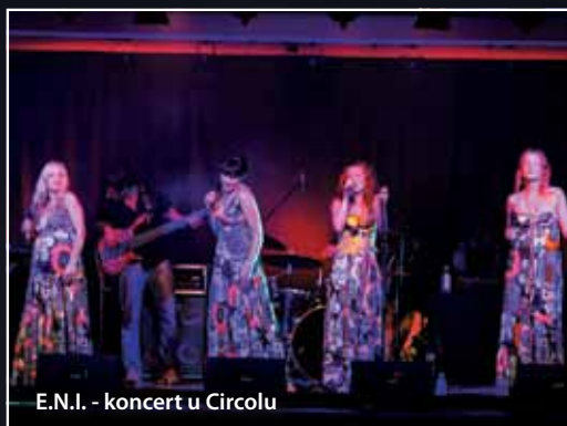
E.N.I. - koncert u Circolu