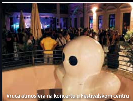
Vruća atmosfera na koncertu u Festivalском centru