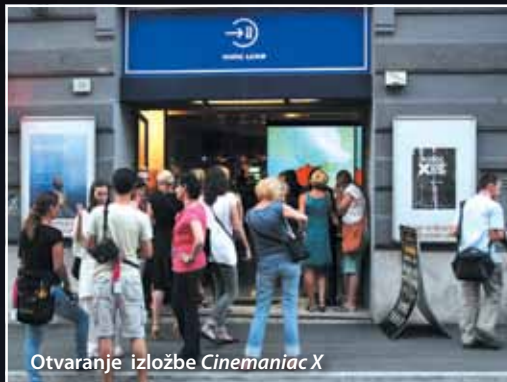
Otvaranje izložbe Cinemaniac X