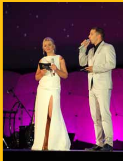
Arena - otvorenje festivala