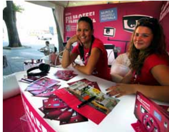
Kiosk Hrvatskog telekoma

Kao i svake godine dosad, HT stavlja u službu kulture i filma svoju vrhunsku tehnologiju želeći ovaj izniman filmski događaj približiti ljubiteljima filma širom Hrvatske koji nisu u mogućnosti posjetiti Festival. Vjerujemo da smo ovogodišnjom ponudom vrhunskih filmova u MAXtv videoteci odmah nakon festivalske projekcije, u tome i ove godine uspjeli.