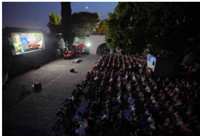
Projekcija na Kaštelu