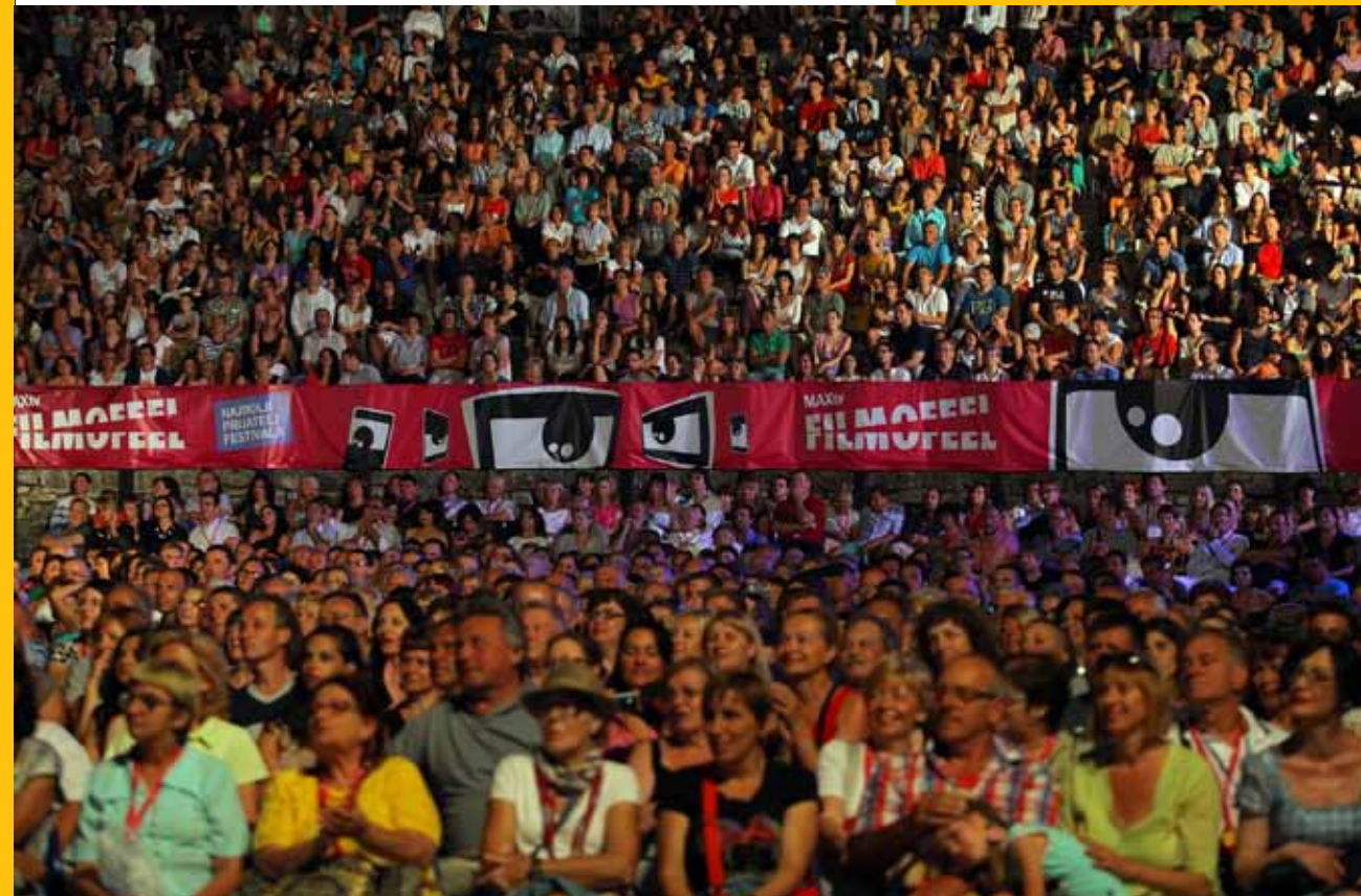
Arena – projekcija filmova

Festival stvara uvjete za međusobno poslovno upoznavanje i umrežavanje festivalskih sponzora