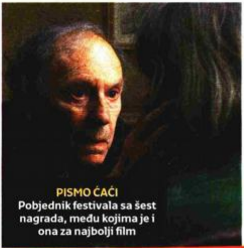
PISMO ČAČI Pobjednik festivala sa šest nagrada, među kojima je i ona za najbolji film