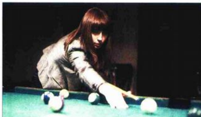
Iz filma "Djeca jeseni" Gorana Rukavine