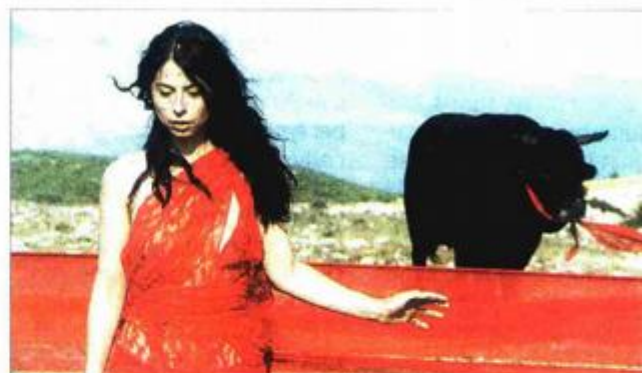
"Sonja i bik" Vlatke Vorkapić otvorit će 59. Pulu