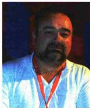
Patljak: Svjetski je raritet snimiti socijalnu art-dramu u 3D-u

Patljak nam otkriva koliko je 3D skupa igračkica i priznaje kako je posao učio uz hollywoodske filmove. - Oko 200.000 eura potrebno je da bi se krenulo u snimanje, plus dodatnih 50 tisuća da za postprodukciju. Budžet tako automatski raste za najmanje jednu trećinu. Jedini je način bio ugledati se na Hollywood. Gledali smo "Avatara", "Tri mušketira"... Uglavnom, pregledavali smo nekih 10-15 filmova, pratili što se radi s jednom, a što s drugom kamerom, kakva