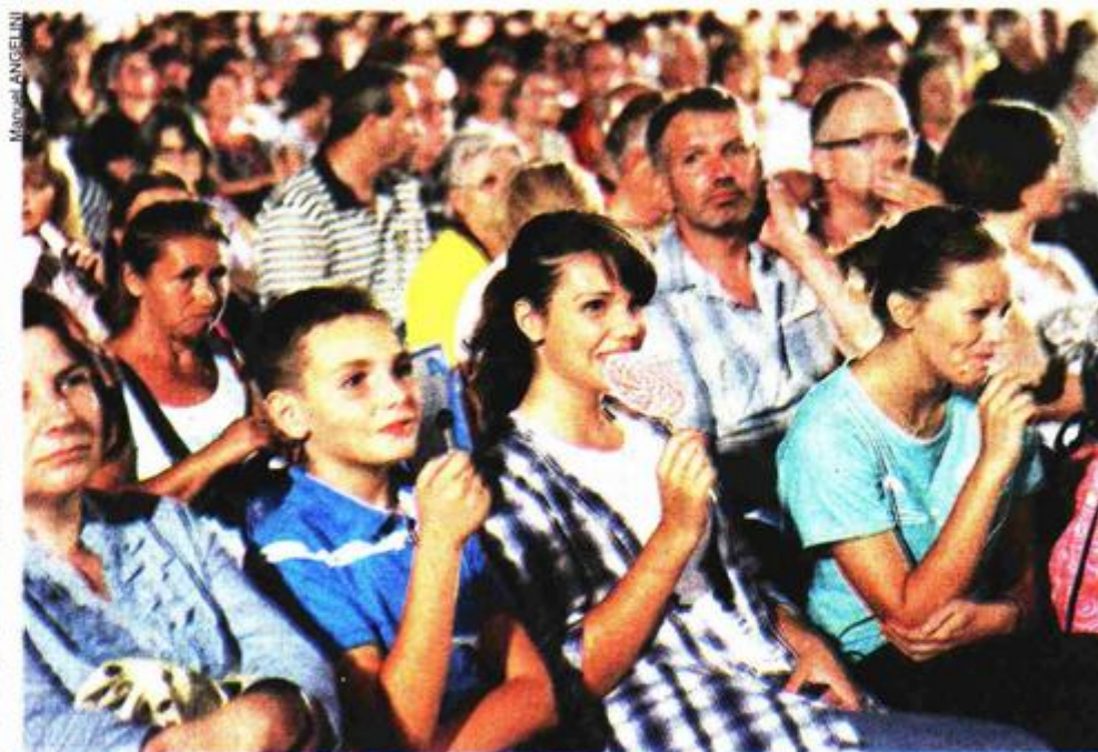
Arena je puna