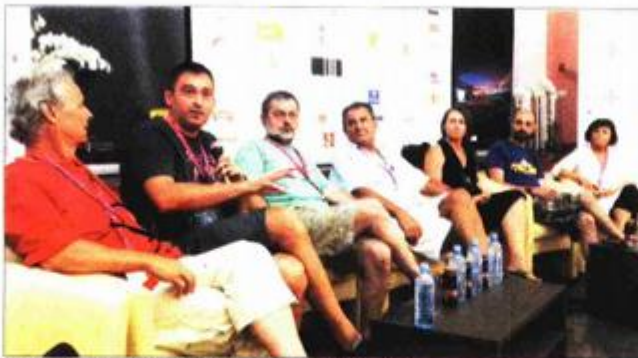
Ekipe filma "Ljudožder vegetarijanac"

angažirati najbolje glumce koje Hrvatska ima. Najveći dio novca kojim je film raspolagao otišao je na glumačke honorare. Ovo je prvi film koji sam radio elektronski i prvi u kojem sam koristio dvije kamere. Snimili smo ga u 21 dan, ali budući da smo imali izvrsne glumačke pripreme, na snimanju se sve poklopilo, rekao