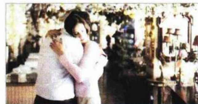
Dolazi i predvodnik nove grčke kinematografije Yorgos Lanthimos, s filmom "Alpe"