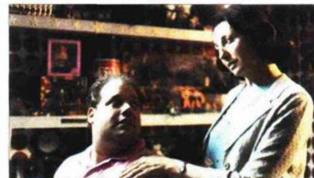
U Motovunu "Tajni adut" Todda Solondza