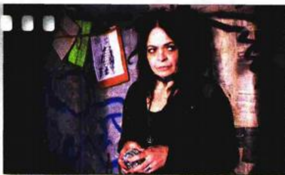
psihološka drama, Hrvatska, 80 min, 2012