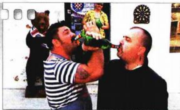
drama, Srbija, Hrvatska, Makedonija, 112 min, 2011.