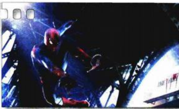
akcijsko-pustolovni, SAD, 2011., 136 min