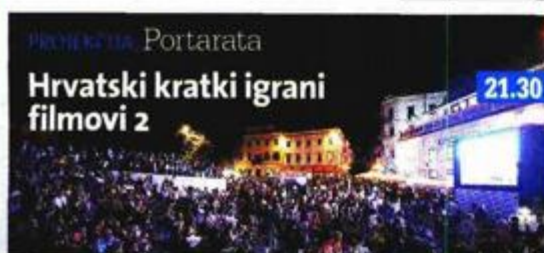
Portarata Hrvatski kratki igrani filmovi 2 21.30

Nacionalističke i neonacističke grupe ujedinile su se da nasilno spriječe gay aktiviste čiju je manifestaciju beogradska policija odbila štiti. Homofobični ratni veterani nade se u situaciji da surađuje s gay aktivistom i stavi se u zaštitu prvog Pridea u Srbiji.