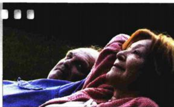
melodrama, Hrvatska, Slovenija, Srbija, 101 min, 2012