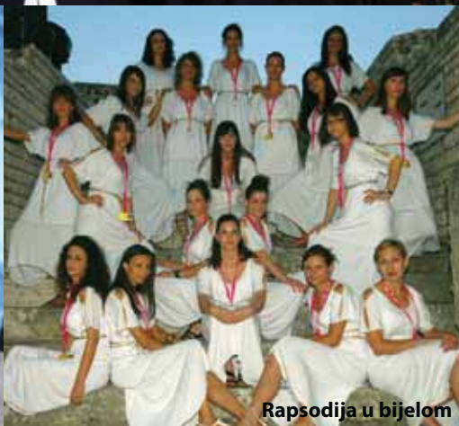
Rapsodija u bijelom