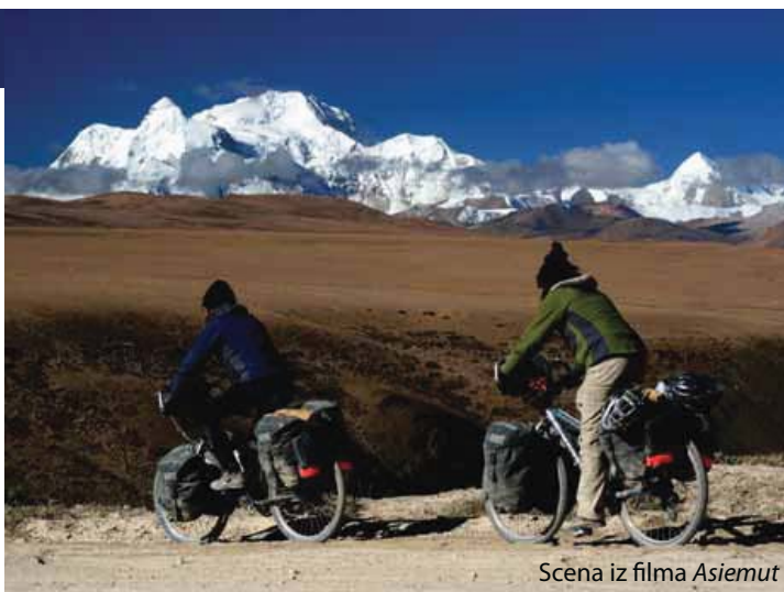
Scena iz filma Asiemut

(redatelj Thomas W a r t m a n n , Njemačka). Ima li boljeg osvježenja u ove sparne večeri od filmskog putovanja u jedan od najhladnijih i – najčudesnijih krajeva svijeta?