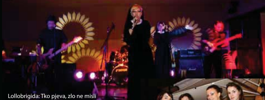
Lollobrigida: Tko pjeva, zlo ne misli