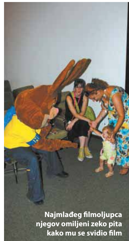
Najmlađeg filmoljupca njegov omiljeni zeko pita kako mu se svidio film