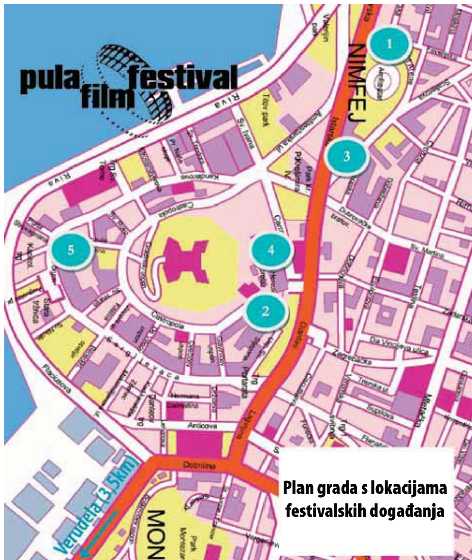
1 - Amfiteatar, 2 - Kino Valli, info punkt, 3 - MMC Luka, 4 - Circolo, 5 - Forum, 6 - Verudela