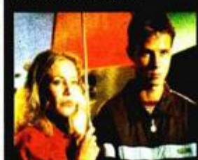
»Sve o mojoj majci«