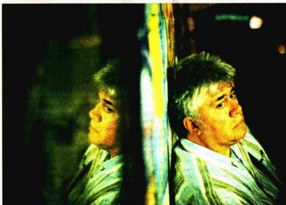
Redatelj koji je proslavio španjolski film: Pedro Almodovar