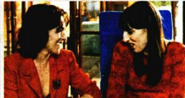
»Žene na rubu živčanog sloma«