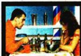
Prizor iz filma »Veži me«