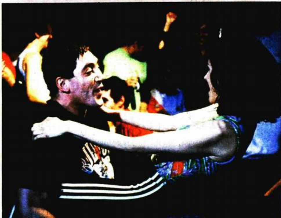
Iz filma »Živo meso«

Almodovar je do temelja prodrmao svjetonazor postfrankovske Španjolske i promijenio recepciju te zemlje u svijetu