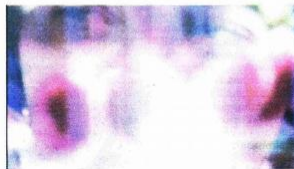
"Alea iacta" - Dario Pejić

Broj snimljenih i prikazanih filmova u Pulscoj filmskoj tvornici narastao je na šezdesetak, a ovaj put smo vidjeli njih deset, od kojih je devet nastalo na prošlogodišnjoj radionici, dok se na jednom radilo još od prethodne godine