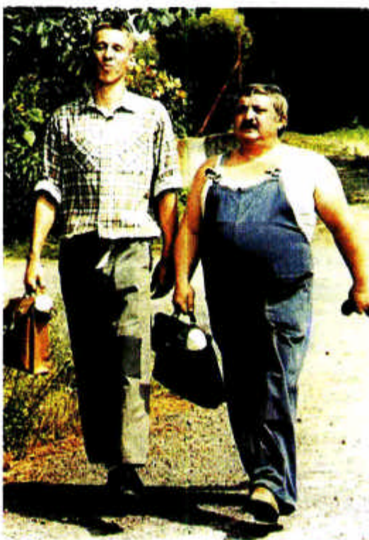
»Selo moje malo«

ljudske karakterne osobine i slabosti. Vrhunac takvog pristupa je Selo moje malo (1985.), gdje Menzel vanserijskom narativnom vještinom spaja uobičajene narativne motive (tinejdžerska seksualnost, preljub u ruralnoj sredini, kritika komunizma i drugo) s nepobjedivim životnim