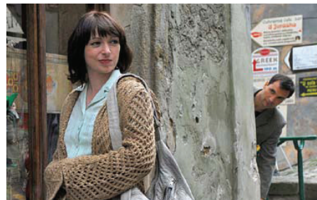
Film je dobio nagradu publike na Međunarodnom filmskom festivalu u Karlovym Varyma 2007.