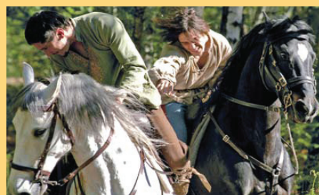
sont gris iz 1999., Micha Wald nametnuo se kao jedan od najperspektivnijih mladih belgijskih filmaša. Ovo mu je dugometražni prvijenac.

O FILMU: Bratsko zajedništvo, gubitak najmilijih i želja za osvetom, u središtu su debitantskog dugometražnog igranog filma mladog belgijskog redatelja Miche Walda strukturiranog u tri dijela. Vraćajući se u 19. stoljeće, Wald opisuje život mladih Kozaka koji bježeći od siromaštva stupaju u vojsku. To su braća Jakub (Adrien Jolivet) i Vladimir (Grégoire Leprince-Ringuet) čije se sudbine prepletu s drugom dvojicom braće, kradljivcima konja Eliasom (François-René Dupont) i Romanom (Grégoire Colin). Našavši se na različitim stranama, okrutni Roman ubije Vladimira i tako izazove Jakubov gnjev koji se zavjetuje na osvetu. U sredini koja ne poznaje milost i praštanje, mržnja i nasilje mogu dovesti samo do nove obiteljske tragedije... Debitirajući kratkometražnim filmom La Nuit, tous les chats