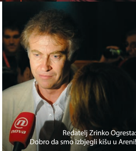
Redatelj Zrinko Ogresta: Dobro da smo izbjegli kišu u Areni!

U Pulu su nakon premijera svojih filmova na festivalima u Cannesu i Veneciji doputovale dvije mlade zvijezde francuskog filma Adrien Jolivet i Stéphanie Crayencour. U četvrtak, 24. srpnja u 18.00 sati projekciju filma Kradljivci konja u Kinu Valli u sklopu programa Europolis-Meridijani najavit će njegov glavni glumac Adrien Jolivet, a u petak 25. srpnja u istom prostoru projekciju filma Ljubav Astreje i Celadona najavit će glumica Stéphanie Crayencour. Press konferenciju oboje će glumaca održati u petak 25. srpnja u 12.00 sati u Circolo.