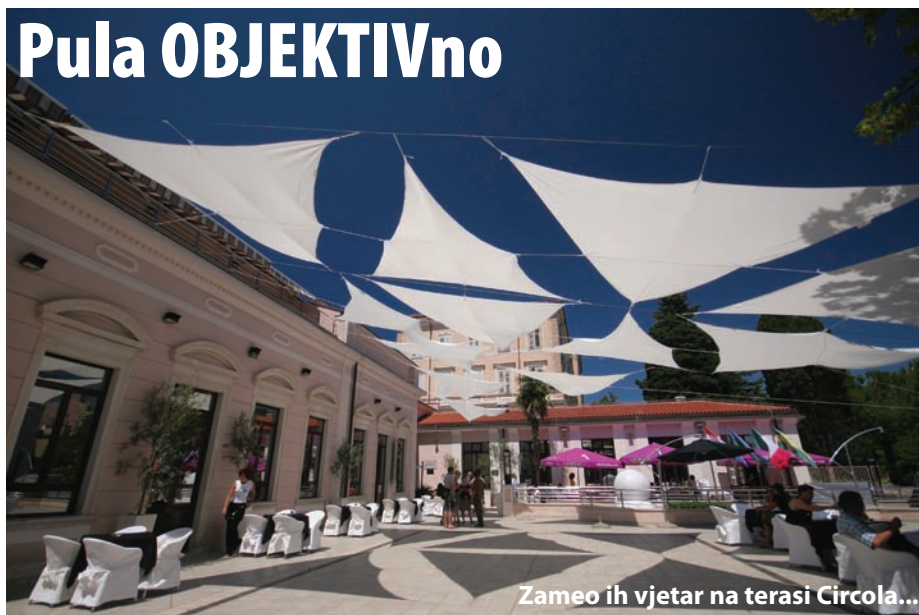
Zameo ih vjetar na terasi Circola...