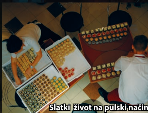
Slatki život na pulski način