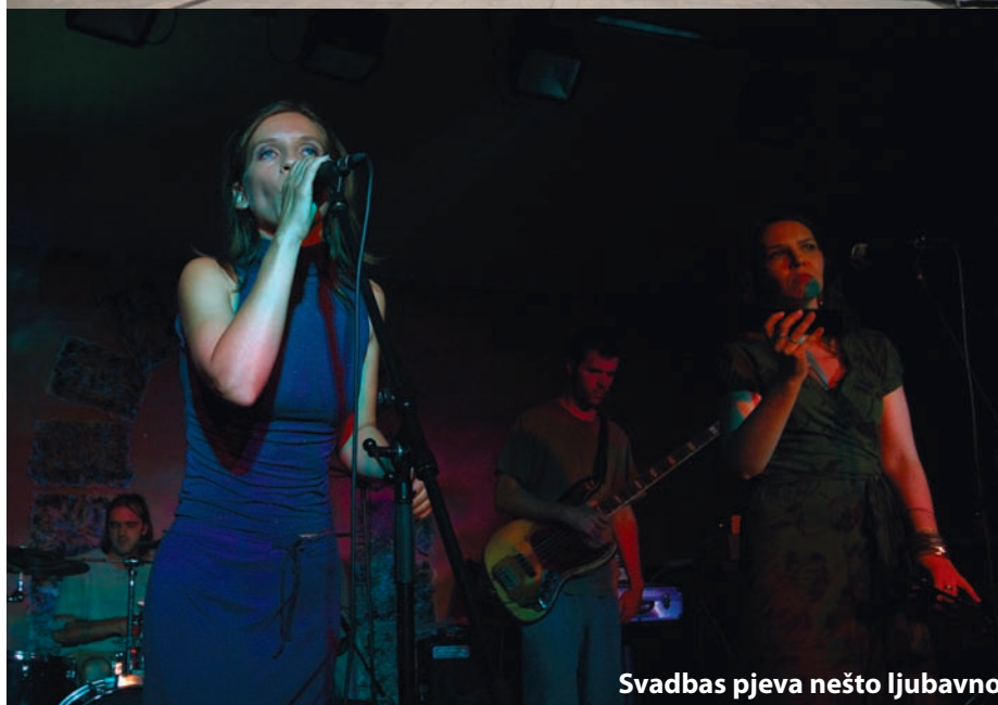
Svadbasa pjeva nešto ljubavno