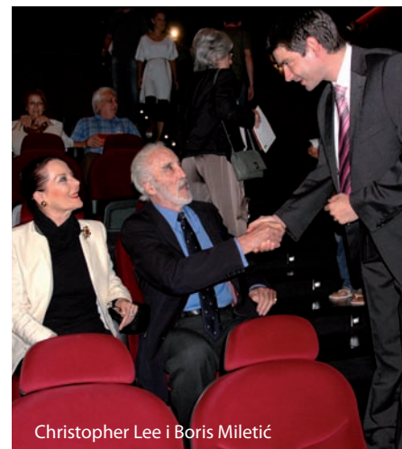
Christopher Lee i Boris Miletić

Tijekom Festivala u Kinu Valli pod nazivom Svijet u malom prikazuju se filmovi iz Međunarodnog natjecateljskog programa Europolis-Meridijani, a početak redovnih kinoprojekcija najavljen je za ponedjeljak 28. srpnja. Prvi filmovi u ljetnom repertoaru bit će norveška humorna drama O' Horten, američki dugometražni animirani film Kung fu panda, američka komedija Seks i grad te britanska povijesna drama Dvije sestre za kralja.