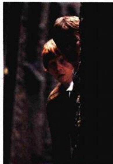
Scena iz filma »Harry Potter i princ miješane krvi«