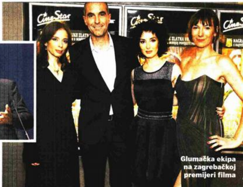
Glumačka ekipa na zagrebačkoj premijeri filma