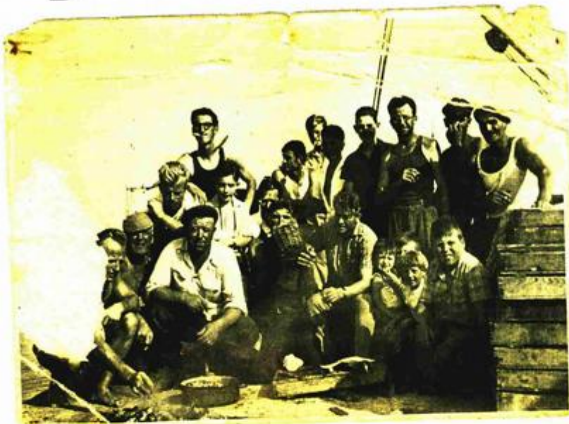
Na brodu na rivi 1952. poziraju turistima dok čekaju marendu