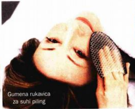
Gumena rukavica za suhi piling