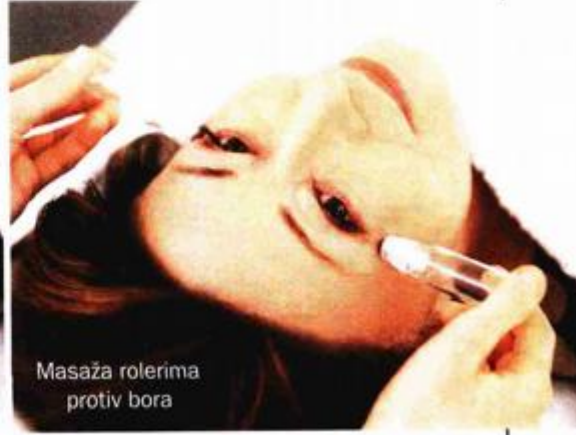
Masaža rolerima protiv bora