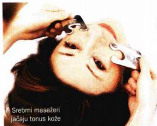
Srebrni masažeri jačaju tonus kože

- Dok sam na moru, na otoku Olibu, natjeram se da svaki dan plivam bar sat vremena ujutro i sat vremena navečer. A mišići lica već osam godina vježbam metodom teenliftinga, koji pruža točno ono što mi treba: poboljšava tonus kože, a fizionomija ostaje moja. Kada za to dođe vrijeme, i Luciji ću to preporučiti - kaže glumica koja nikada nije ni pomišljala na kiruške zahvate jer joj je, kaže, vrlo važno da joj ekspresija lica ostane nepromijenjena. ■