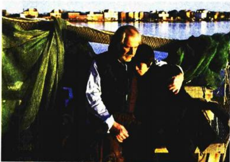
"Shun Li i Pjesnik"

Segreov film dodatno učvršćuje tezu da će se suvremena talijanska kinematografija vrlo teško otrgnuti teretu slavne povijesti. Doduše, današnja iznimno teška ekonomska i socijalna situacija može biti vrlo poticajna, budući da su brojna velika umjetnička djela nastajala upravo u teškim društvenim uvjetima. Ipak, postavlja se ključno pitanje: imaju li Talijani duhovne snage za neki novi neorealizam?