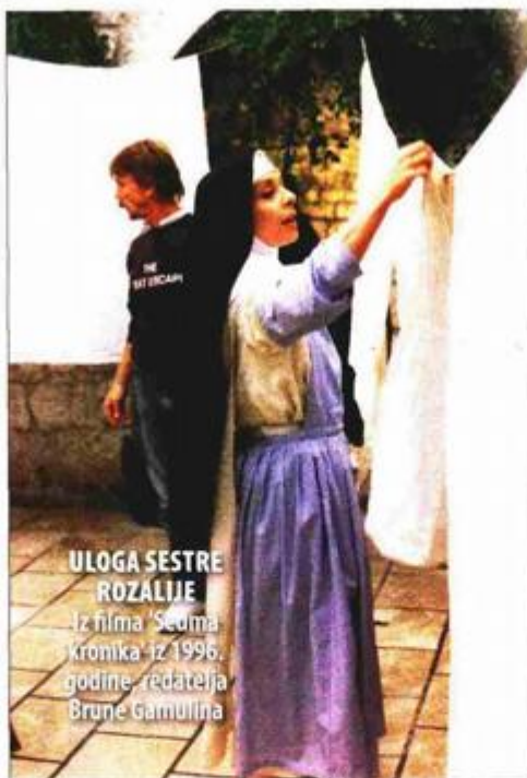
ULOGA SESTRE ROZALIJE Iz filma "Šuma kronika" iz 1996. godine, redateljica Brunč Gamulilna

- Puno sam se puta mučila. Kad bismo sad sve nabrajali, trebalo bi nam tri dana da se izrazgovaramo. Najviše opterećuju ove najzvučnije uloge, velika lica gdje svi sve znaju o tome i svi imaju predodžbu kako se to igra. Evo, trenutno kod "Alana Forda". Svi znaju sve o tome, pa je onda tu veći teret na leđima. Ali zapravo, s ovim iskustvom koje sad imam, ipak čovjek stresa sve sa sebe, krene raditi od nule i