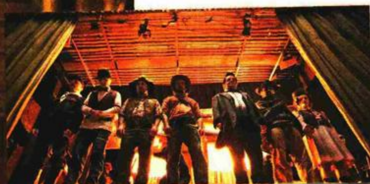
Glumačka postava filma istovjetna je predstavi