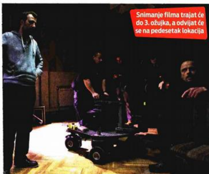
Snimanje filma trajat će do 3. ožujka, a odvijat će se na pedesetak lokacija