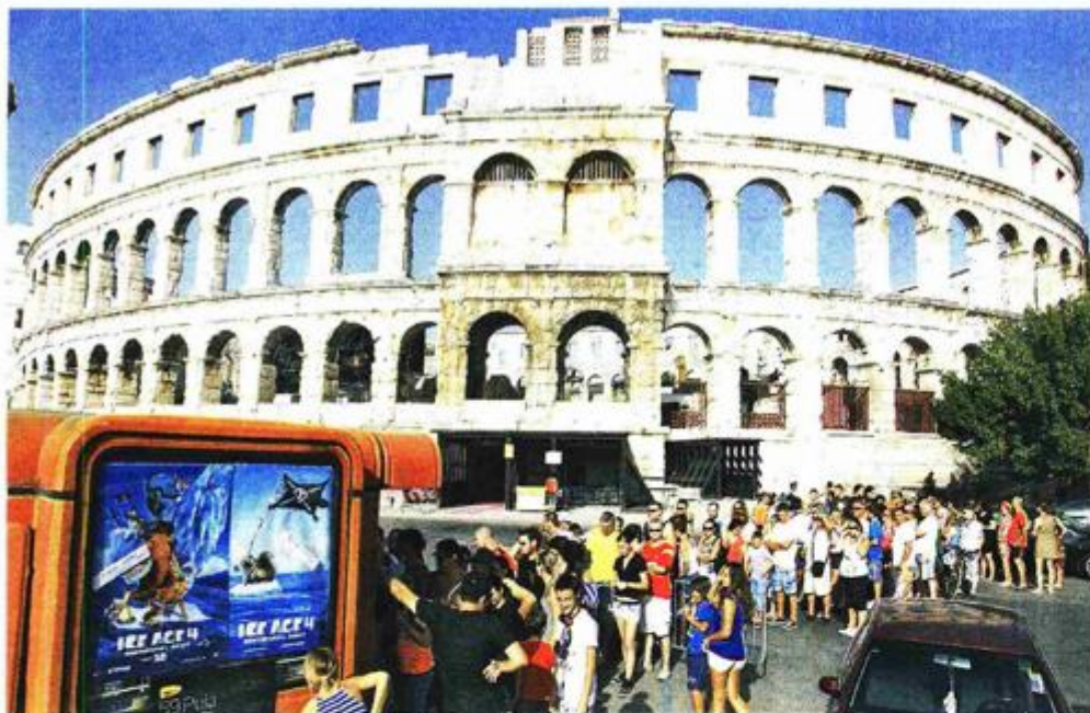
Pula, Arena – kultno mjesto domaćeg filma koje ove godine slavi 60. obljetnicu