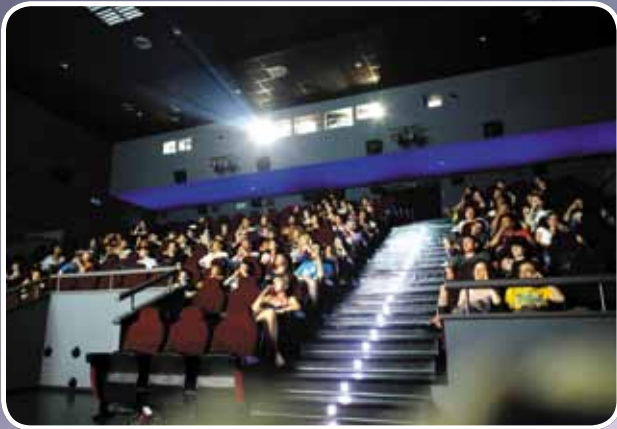
Novi kratki hrvatski igrani filmovi u Kinu Valli