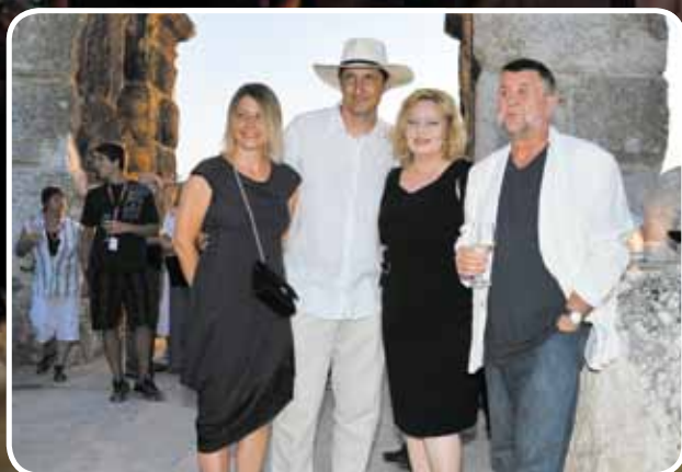
Neka ostane među nama u Areni