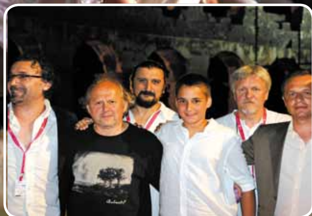
Ostavljani u Areni