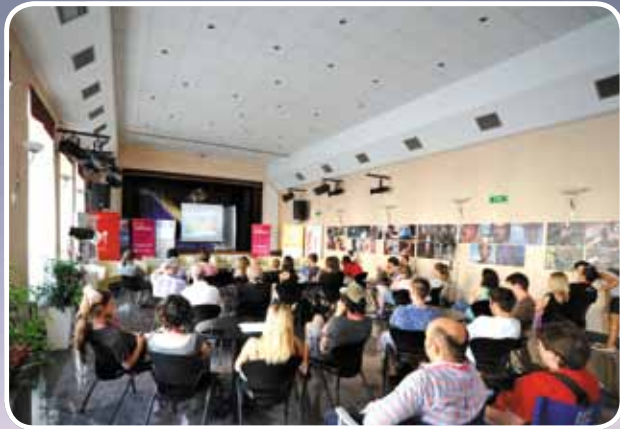
Master Class Dade Valentića u Circolu