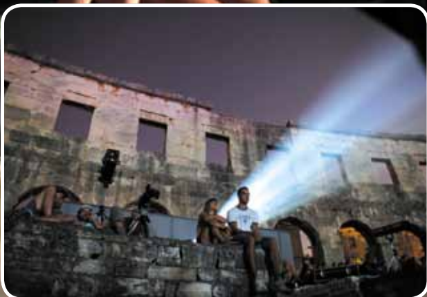
Najbolja mjesta u Areni