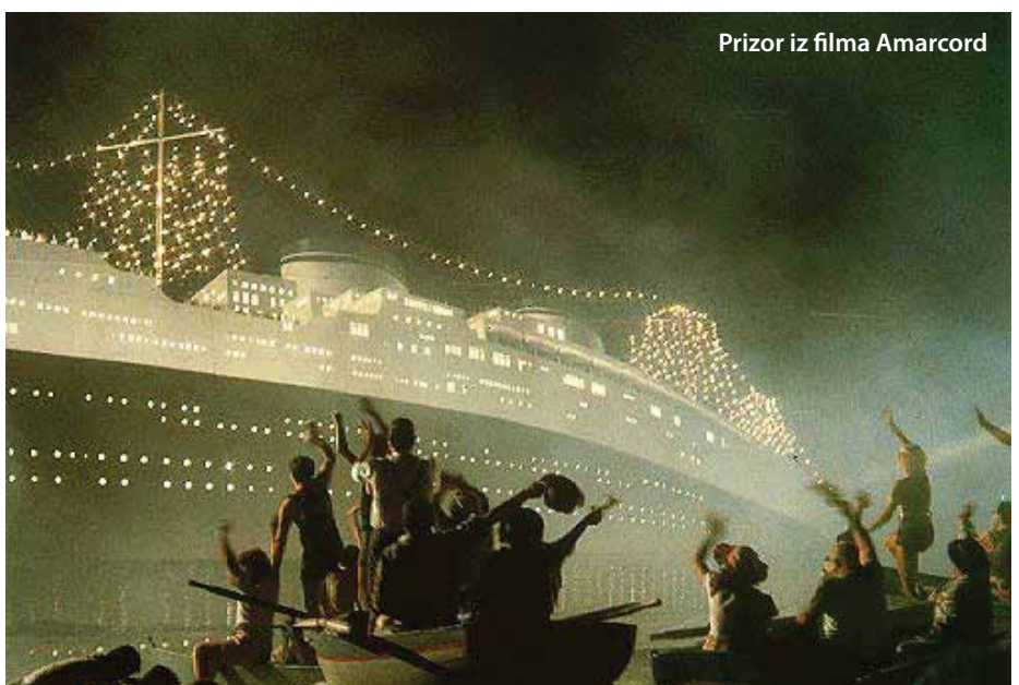
Prizor iz filma Amarcord