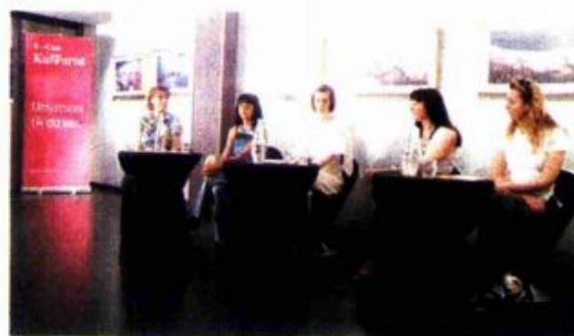
S konferencije za novinare 57. festivala igranog filma u Puli