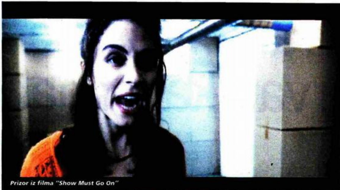
Prizor iz filma "Show Must Go On"