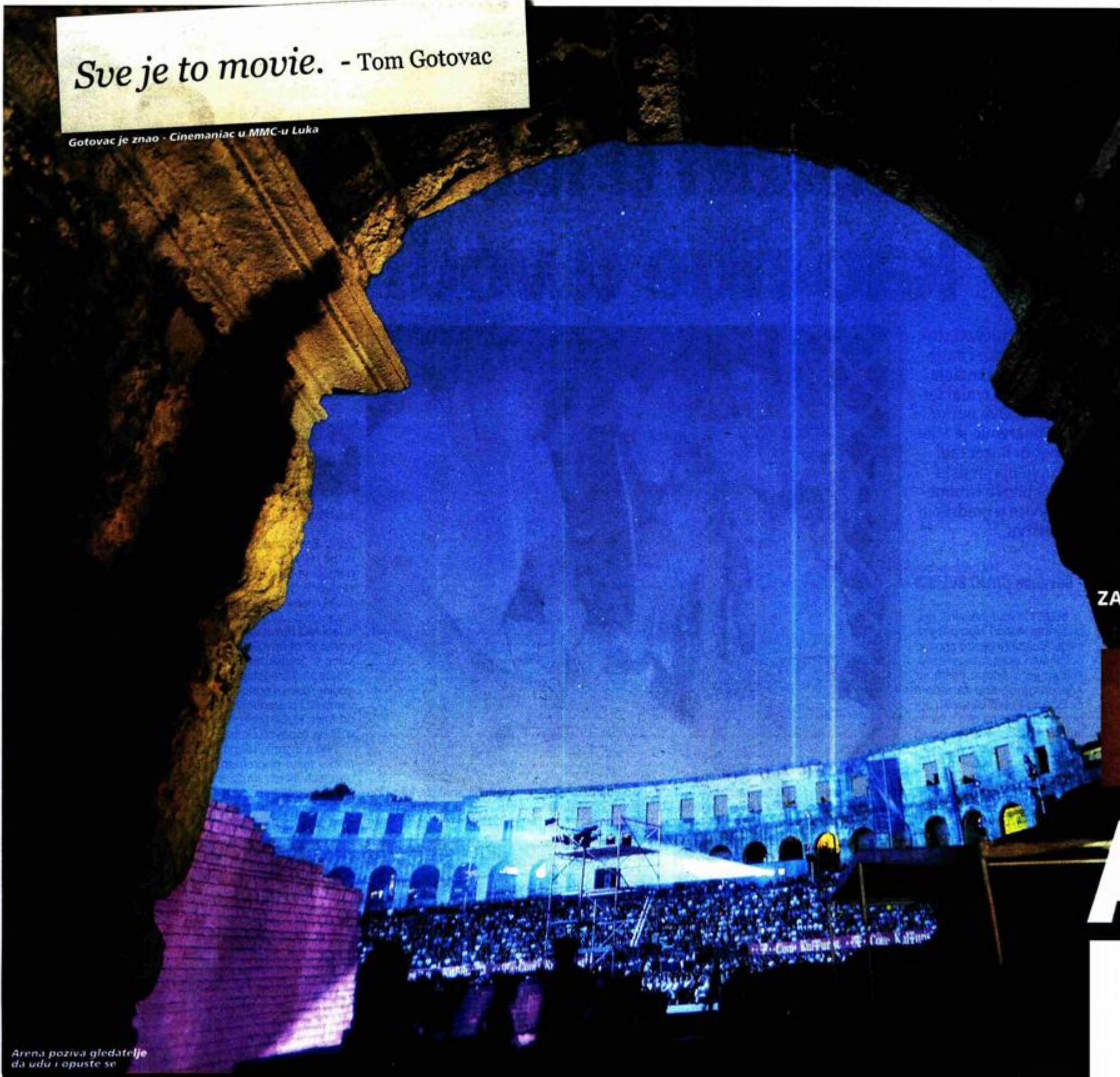
Arena poziva gledatelje da uđu i opuste se

Gotovac je znao - Cinemaniac u MMC-u Luka