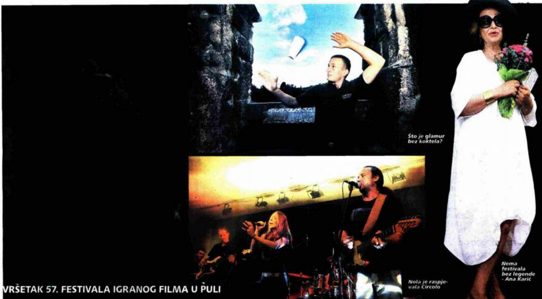
Što je glamur bez koktela?