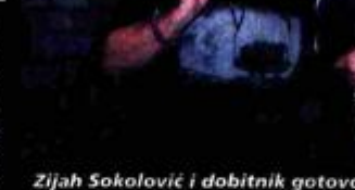
Zijah Sokolović i dobitnik gotovo svega - Rajko Grlić

vidljivo je puno živopisnih detalja. U jednom uglu vidi se pulski Kaštel koji je povećao broj sjedala s 300 na 600 i u istom trenu udvostručio svoju publiku. Niže je kino Valli, koje onim Puljanima koji su godinama trunuli bez kina još uvijek izgleda kao fatamorgana. Bliže centru kadra su terasa Circola, veliki ekran na Portarati i koncertna euforija na Forumu, ali u sridi je Arena. Što reći o glumcima i filmskim ekipama koje su danima šetale gradom? Oni privlače pažnju ljudi, ali nikako da se natjeraju biti glamurozni. Možda je opuštena atmosfera koja vlada festivalom ulijevala stanovnike crvenih tepiha, a možda shvaćaju da u cijeloj