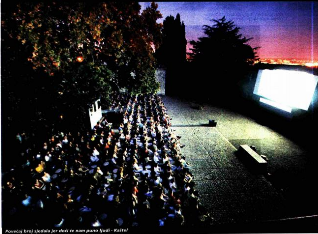
Povećaj broj sjedala jer doći će nam puno ljudi - Kaštel

Napisao Boris VINCEK