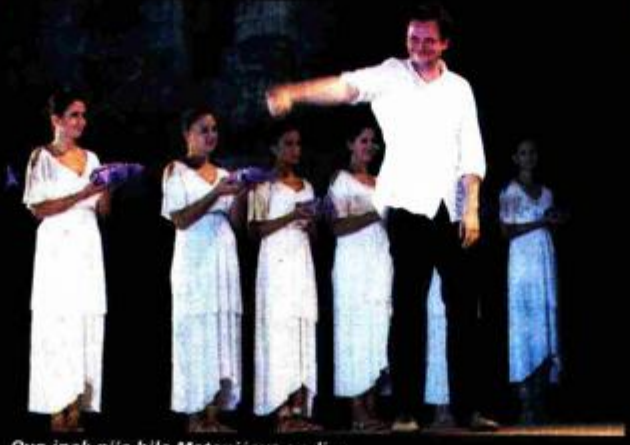
Ovo ipak nije bila Matanićeva godina