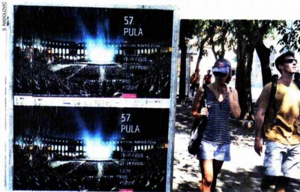
Pula već danima živi "filmski"

ra otkriva ljepotu sitnica svakodnevice. U čast festivalskog otvaranja, a u povodu devedesete obljetnice rođenja velikog talijanskog redatelja Federica Fellinija (1920.-1993.) večeras u 19.30 sati u dvorani Circola, slavni svjetski trubač Mauro Maur uz klavirsku pratnju Françoise de Close održat će koncert sa skladbama iz njegovih najslavnijih filmova koje je napisao jedan od najvećih svjetskih skladatelja filmske glazbe - Nino Rota. Maur i de Close izvest će i skladbe Ennija Morriconea. U kinu Valli u 16 sati filmska publika moći će pogledati reprizu filma iz međunarodnog programa Europolis-Meridijani "Transfer" redatelja Damira Lukačevića, dok je u 17.40 sati na programu projekcija francuskog filma ceste "Daj mi ruku" redatelja Pascala-Alexa Vincenta.